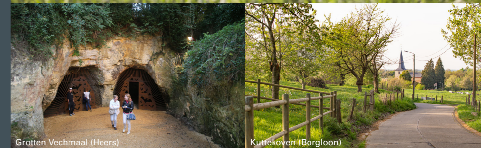
Grotten Vechmaal (Heers)