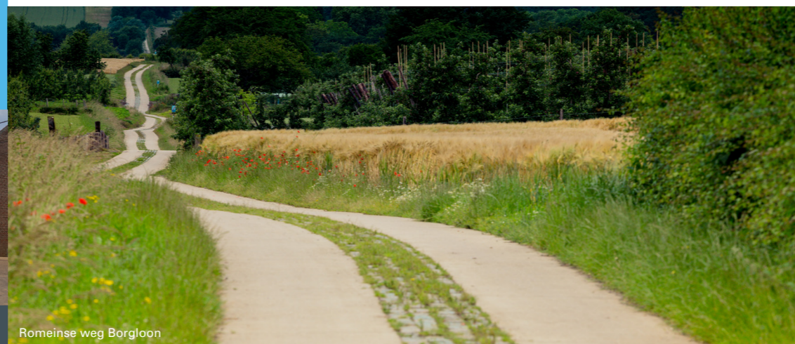
Romeinse weg Borgloon