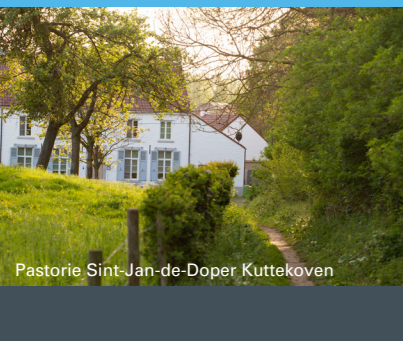
Pastorie Sint-Jan-de-Doper Kuttekoven