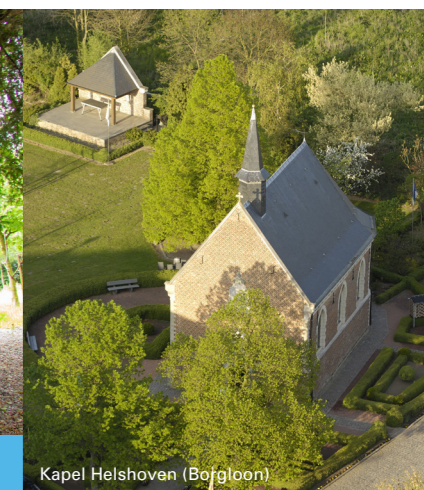
Kapel Helshoven (Bofgloon)