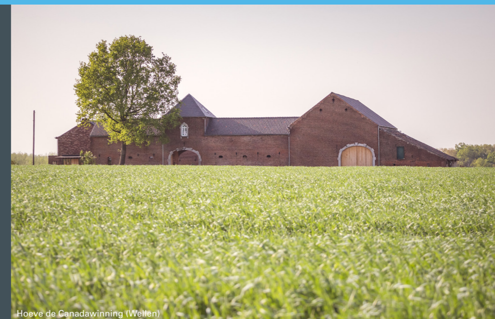
Hoeve de Canadawinning (Wellen)